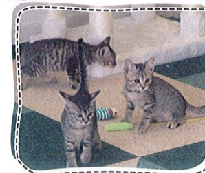
●かわいい子猫たちも 沢山の猫たちが、新しい家族を待っています。

生体の費用は いただいておりますが、 譲渡までにかかった医療費など のご負担をお願いしております。 猫によって変わりますので、 詳しくはお問い合わせを。 ★例:5種ワクチン2回接種、ウイルス検査、 マイクロチップ挿入の子猫で18,000円 前後。避妊・去勢手術を行った場合、 更に10,000円~16,000円程追加。