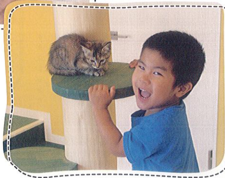
●お子様と一緒に猫と触れ合おう! 猫と楽しく触れ合ってください。一緒にあそぶだけで心がとても癒されますよ。