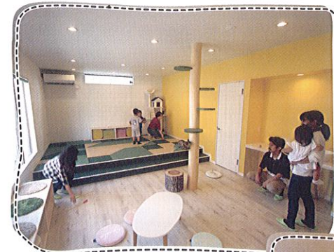
●店内の様子 清潔な店内で、猫たちは自由にくつろいでいます。一緒にのんびりくつろぎませんか?