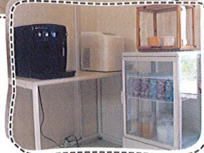
●ドリンクバー 各種ドリンクを完備しております。おかわりは自由です。